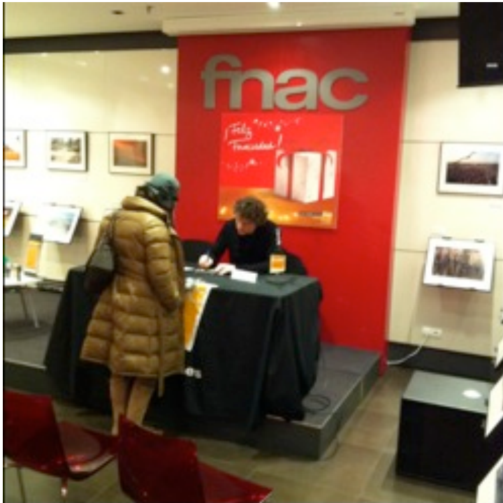
Momento da charla co pianista Paul Lewis, A Coruña 7-12-2010

Dentro das actividades que realizamos en colaboración coa Orquestra Sinfónica de Galicia, enmárcase este encontro entre o pianista Paul Lewis e alumnado e profesorado do Departamento de Piano do noso centro na tenda FNAC de A Coruña. Durante esas datas, o pianista inglés ofreceu a integral dos concertos para piano e orquestra de Beethoven coa OSG baixo a dirección de Víctor Pablo Pérez. O alumnado do noso Departamento de Piano tamén tivo a oportunidade de asistir aos ensaios previos a estas actuacións.